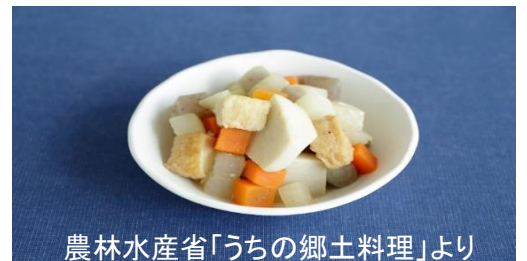
農林水産省「うちの郷土料理」より

土佐市では、煮る材料が9品揃うと「いとこ煮」と呼ばれ、これは、大根・人参・ごぼう・里芋・こんにやく・豆腐といった、ジャンルの近い食材を「いとこ」に見立てたもので、3つの「いとこ」がそろったら、「いとこ煮」となるとされています。