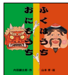
ふくわうちおにもうち 内田麟太郎 文 山本 孝 絵 岩崎書店