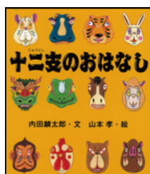
十二支のおはなし 内田麟太郎 文 山本 孝 絵 岩崎書店

こんげつ じゅうにし せつぶん 今月は十二支と節分について、同じ絵の作者と文の作者の本を紹介します。